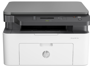
HP Laser MFP 135a